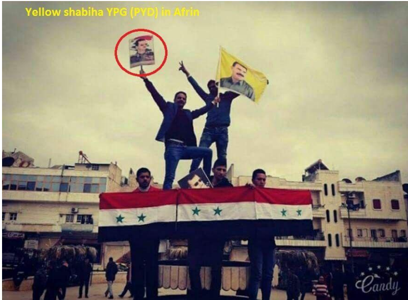
Yellow shabiha YPG (PYD) in Afrin