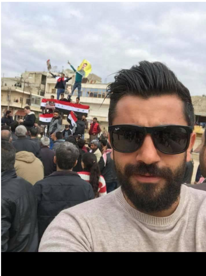
Войска Асада въезжают в Кобани в 2019 году по приглашению СДС: