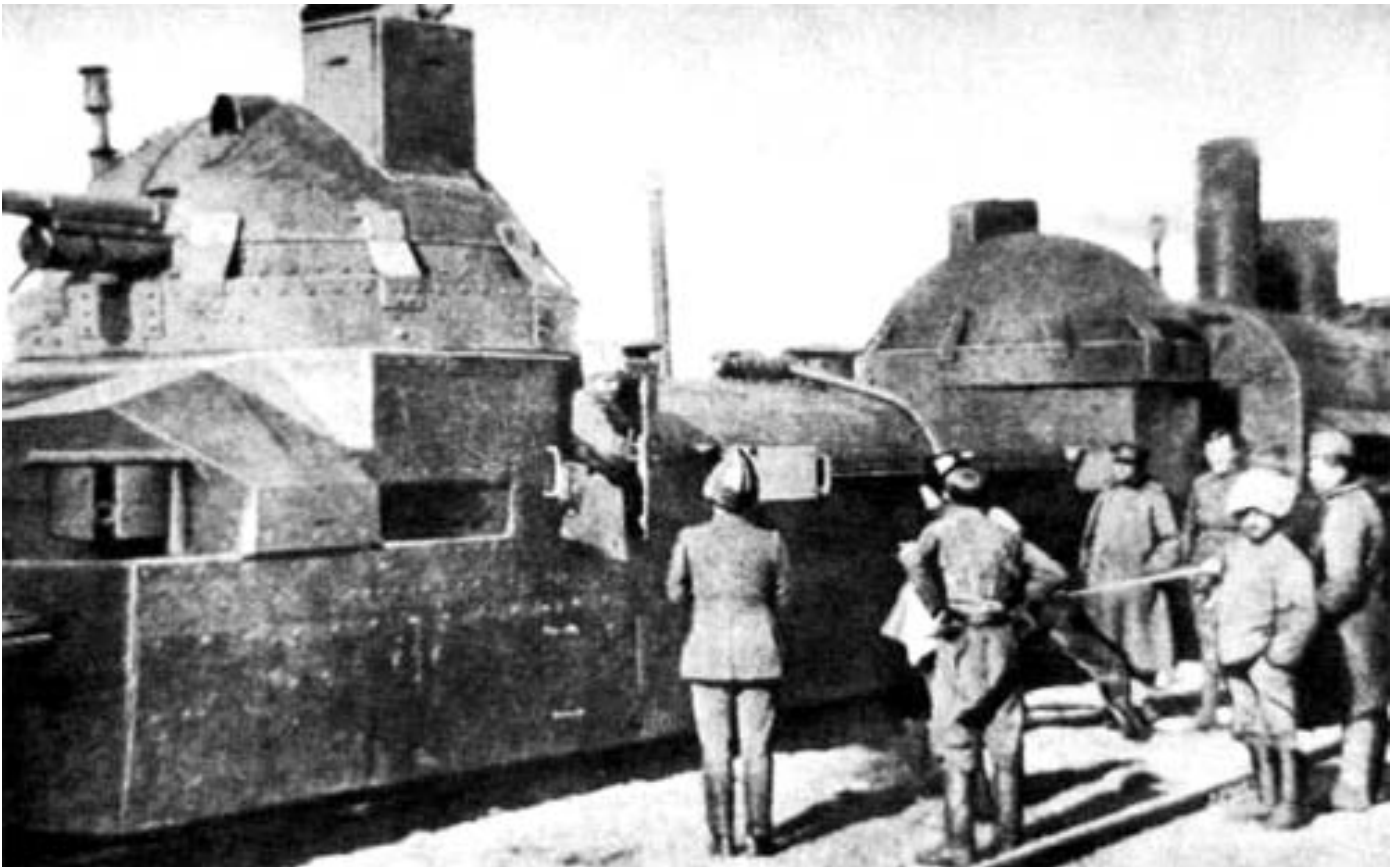
Der gepanzerte Zug "Leo Trotzki" während des Bürgerkrieges in Russland

Offensichtlich hängt das Ausmaß, in dem eine bolschewistische Organisation Arbeit unter den Massen verrichten kann, sowohl von der aktuellen Klassenkampfsituation als auch von den subjektiven Kräften ab. Je kleiner die Organisation, umso strenger muss sie die Gebiete und Intensität ihrer Arbeit unter den Massen selektieren. Um exemplarische Massenarbeit zu verrichten, sind kommu-