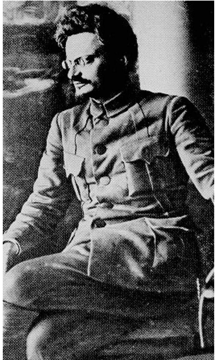
Leo Trotzki: Führer der Oktoberrevolution 1917 . Er setzte Lenin's Kampf für das revolutionäre Programm nach dessen Tod fort.

dass die ArbeiterInnenklasse nur einen kleinen Teil der Gesamtbevölkerung darstellte und unter Arbeits- und Bildungsbedingungen lebte, die die regelmäßige Teilnahme an revolutionären Aktivitäten extrem schwierig und gefährlich machten.