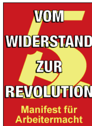
Programm der Liga für die Fünfte Internationale