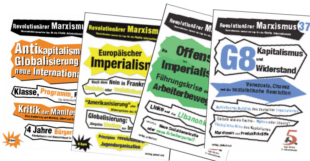
REVOLUTIONÄRER MARXISMUS - Deutschsprachiges theoretisches Journal der Liga für die Fünfte Internationale