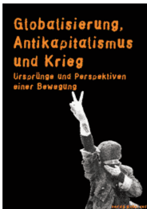
Buch über Globalisierung, Antikapitalismus und Krieg